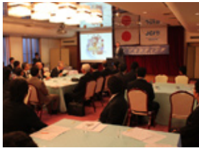
JCブランディング ～本気でJCを語る為に～ (11.10.22)