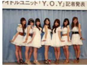
市民協働プロジェクト 期間限定アイドルユニット Y.O.Y 誕生(11.8.2デビュー)