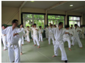
研修事業「JC道場2010」 ～家族同然の絆～(10.6.5-6)