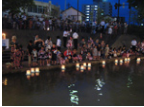
柿川灯籠流し事業(11.8.1)