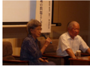
故郷 ～自国の問題を地域の問題 として考える～(11.7.13)