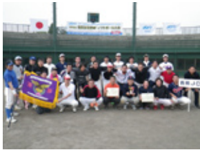
野球・ソフトボール大会(11.5.15)