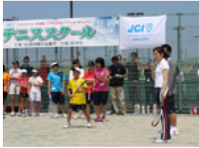
杉山愛テニス教室 ～Dreaming Tennis School～ (11.6.19)