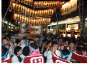
宵宮神輿「夢神輿」事業(11.8.1)