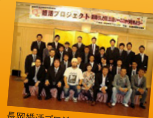
長岡婚活プロジェクト(09.9.27)