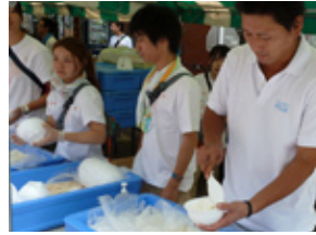
地消地産まつり くおーれながおか(11.9.4)