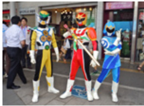
クラブ ソイガイヤー (2011長岡まつりにて)