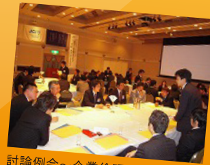
討論例会～企業倫理を考える～ その時、あなたならどうする？ (09.3.9)

会員は営利を追求する企業人でありながら、また一方では見返りを求めず、地域社会に奉仕運動を行っています。これこそ人間として当たり前の行動であると確信しているからです。そのようなことをJCでの体験を通じて学ぶことができます。さらに、経営者・管理者としてのノウハウや指導力を学んでいただくため、様々な事業活動を創出しています。会社への投資はいつでもできますが、自分自身への投資は若い限られた時間にしかできません。JCには何年か後に経営者・管理者となる同世代の人々が多数在籍しています。異業種の方とJC活動を通じて情報交換等をするなどの機会を与えてくれます。是非とも経営力・指導力を身につけてください。